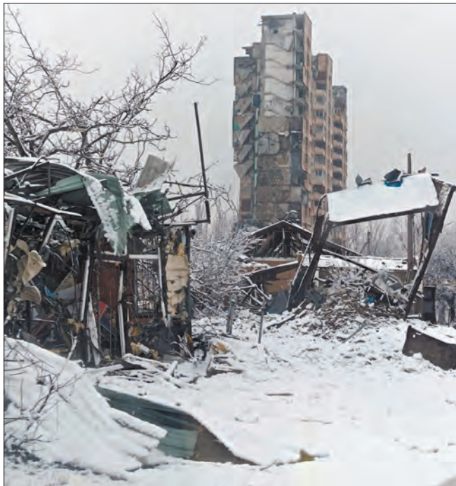
На в'їзді в Авдіївку височіє пам'ятник зухвалості «орків». Колись там вирувало життя — зараз кровонеспинна рана, як зріз ножем по живому...