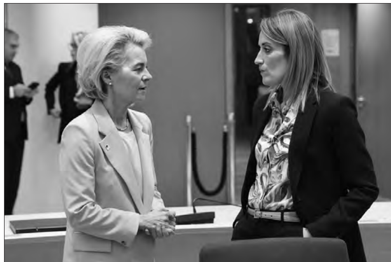
Президентки Єврокомісії та Європарламенту Урсула фон дер Ляєн і Роберта Меццола.

Її думку підтримали чимало учасників саміту, зокрема Президент Литви Гітанас Науседа. «Я думаю, що в нас є шанс, історичний шанс ухвалити дуже сміливе рішення щодо початку пе-