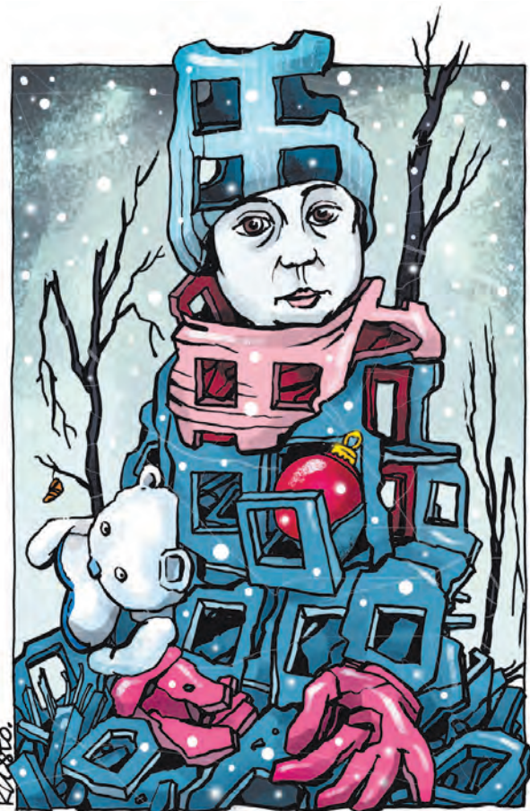
Дівчинка із кулею в серці.