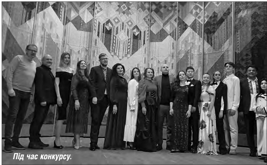
Під час конкурсу.