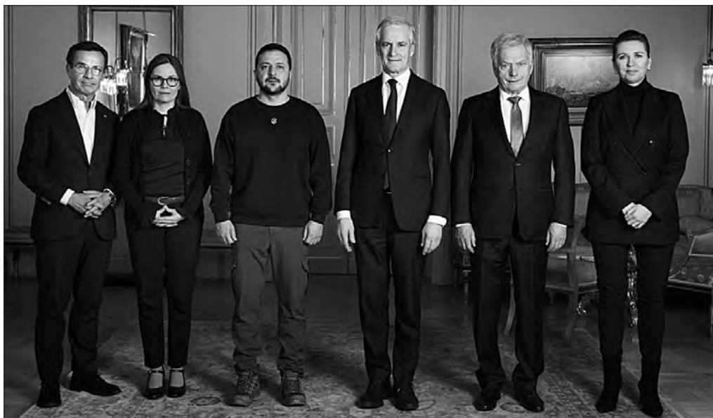
Ульф Крістерссон, Катрін Якобсдоттір, Володимир Зеленський, Йонас Гар Стере, Саулі Нініньо та Метте Фредеріксен.

Прем'єр-міністру Швеції Ульфу Крістерссону Президент України подякував за вагомий фінансовий, гуманітарний та військовий допомогу Україні від початку повномасштабного вторгнення росії, за посилення оборонних спроможностей нашої країни,